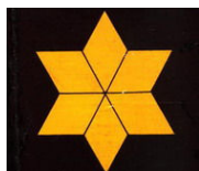
Insignia de Alférez Provisional

“Llegó la Guerra Civil, se incorporó a ella y al final me le encontré de alférez provisional en una Bandera de Falange, donde era el más borracho de todos los alféreces provisionales , y cuando se desmilitarizó, se limitó a quedarse de maestro nacional, ya que a los excombatientes que teníamos Bachiller nos daban el título fácilmente , y así, de maestro de pueblo, ha terminado sus días, como hombre raro, soltero y solitario.” 6